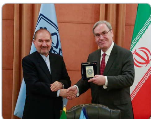
دیدار و گفتگوی سفیر فرانسه با رئیس دانشگاه شهید بهشتی