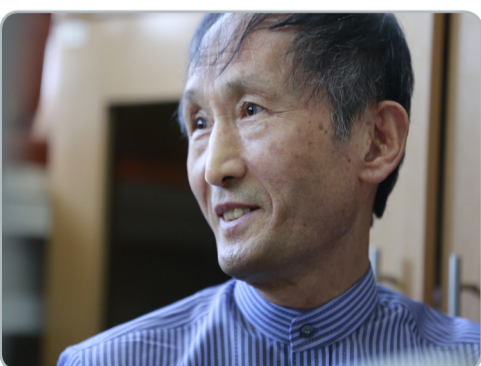
از دانشگاه ملی جی اونگ سانگ کره جنوبی تا دانشگاه شهید بهشتی